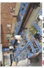
⑦ 三寺めぐり朝市 6月～11月

飛騨市役所観光課 〒509-4292 岐阜県飛騨市古川町本町2-22 TEL 0577-73-2111(代) ホームページ: http://www.city.hikari.gifu.jp/kanko/ E-mail: syokokokanko@city.hikari.gifu.jp (社)飛騨市観光協会 〒509-4235 岐阜県飛騨市古川町三之町2-20 TEL 0577-74-1192 E-mail: info@hikari-tourism.com 飛騨市観光案内所 〒509-4225 岐阜県飛騨市古川町金森町8-32 TEL・FAX 0577-73-3180