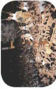
① 起し太鼓の里 飛騨市役所 TEL 0577-73-2111(代)