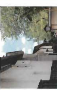
③ 瀬戸川と白壁上蔵街