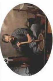
④ 起し太鼓の里 飛騨市役所 TEL 0577-73-2111(代)